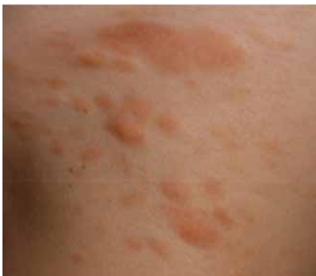
2. ábra | Urticaria pigmentosa klinikai megjelenése 28 éves nőbetegünkön