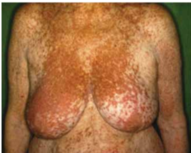
3. ábra | Teleangiectasia macularis eruptiva perstans klinikai megjelenése 80 éves nőbetegünkön

lázat mutatja be. Húsz betegnél urticaria pigmentosát (UP), egy beteg esetében teleangiectasia macularis eruptiva perstans (TMEP) észleltünk. Egy betegnek nem volt mastocytosisnak megfelelő bőrbeszűrődése, őt flush miatt vizsgáltuk.