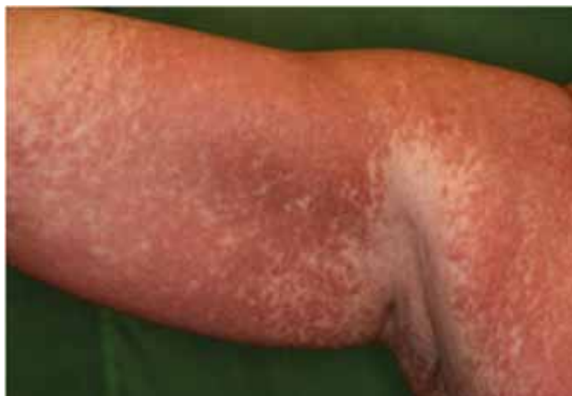
1. ábra | Urticaria pigmentosa klinikai megjelenése 57 éves nőbetegünkön