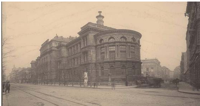
4. ábra: Erdélyi felvétele az Orvosi Kar központi épületéről (Fővárosi Szabó Ervin Könyvtár, Budapest Gyűjtemény)

a formálódó, ekkoriban virágkorát élő főváros minden napjait, neves eseményeit és épületeit kezdte megörökíteni (4. ábra).