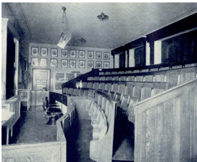
9. ábra: A Stomatológiai Klinika előadóterme, a szemközti falon a képekkel