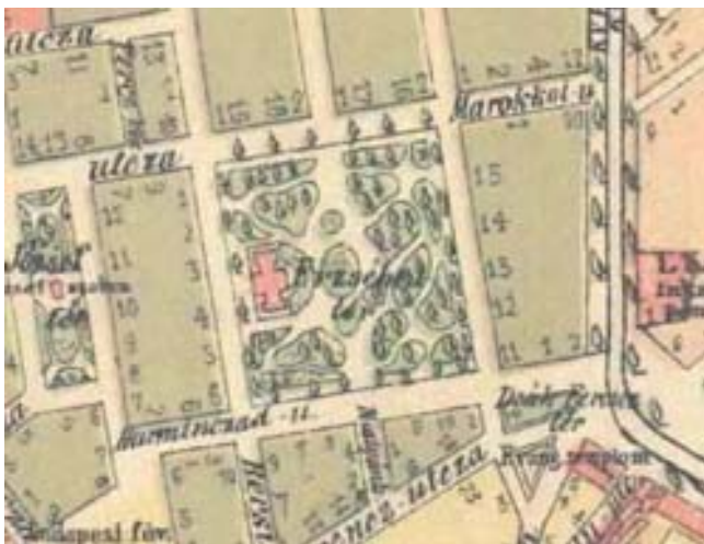
2-3. ábra: Erdélyi Mór első műtermének helyszíne és az épület

Erdélyit sikeres műtermi portréfotói hamar ismertté tették. Ő azonban szélesebb érdeklődési körét kielégítendő,