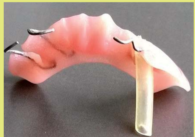
3. ábra: Alaplemezből, retenciós eszközből (hajlított drót kapocs) és dréncsóból álló bilaterális cystaszűkítő készülék

Hátránya: fontos anatómiai képletek, ér- és idegsérülések, vérzések keletkezhetnek, továbbá nem mindig megoldható a fogak, csontok és az arcüreg megóvása. A képződött koagulum széteshet, befertőződhet. Ezzel szemben a dekompreszió számos előnye és egyetlen hátránya van. Előnye az egyszerű kivitelezhetőség, a fontos anatómiai képletek megóvása, kisebb a