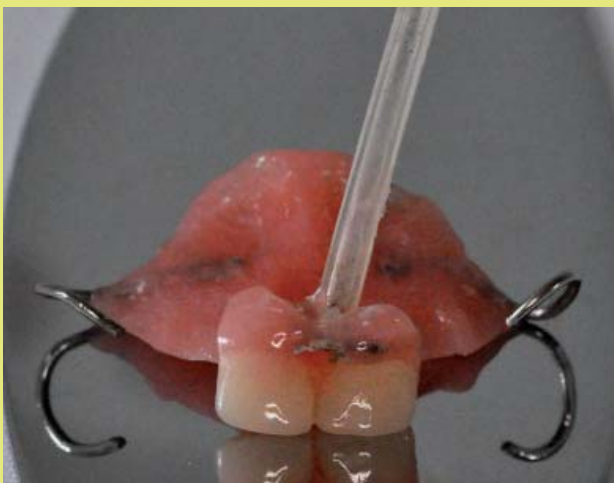
5. ábra: Alaplemezről, retencióeszközből (hajlított drót kapocs), műfogakból és dréncsőből álló ideiglenes részleges lemezes fogpótlás jellegű cystaszűkítő készülék

ideális esetben a cysta teljes remissziójával. Fontos ez idő alatt a páciensek rendszeres ellenőrzése és visszahívása. A cysta méretét addig szűkítjük, amíg biztonságosan elvégezhető lesz az enukleáció, így megkímélve a környező anatómiai képleteket.