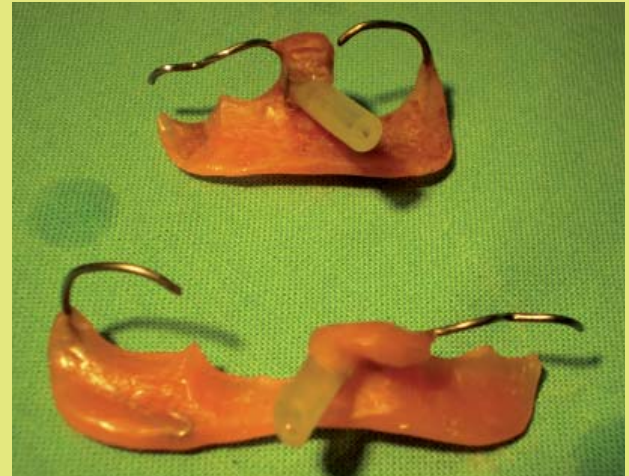
2. ábra: Alaplemezből, retenciós eszközből (hajlított drót kapocs) és dréncsóból álló unilaterális cystaszűkítő készülék

a cystectomy, más néven Partsch II. műtét a cystaszövet azonnali teljes eltávolítását jelenti.