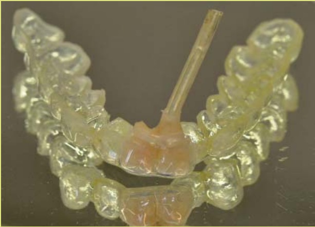
1. ábra: Mélyhúzott fóliából és dréncsóból álló cystaszűkítő készülék