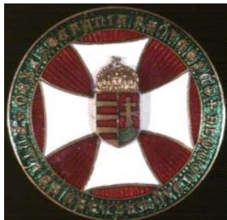
A Stefánia Szövetség védőnői jelvénye

sem okoz aggályt. A dunai hullák nem öngyilkosságból erednek, hanem tömeggyilkosságok következményei. ... Szóba került, hogy a kormányzó gyilkosokat bérelt fel.” Mindezek alapján 1921. július 23-án börtönre ítélték, de ő a tárgyalást és a várható ítélet be nem várva