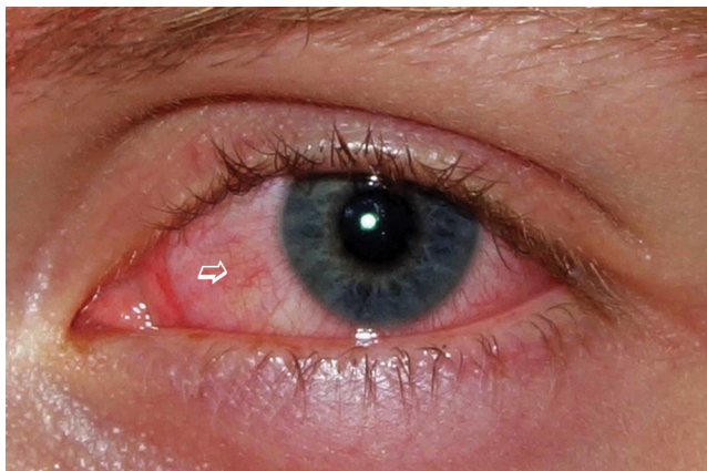
1. ábra | Kilencéves fiú bal szemének képe friss kanyarófertőzésnél. Jól látható a szaruhártya körül kialakulóban lévő „vörös szem” tünet, amely a bulbaris kötőhártyaerek kezdeti kitágulásának felel meg (vastag fehér nyíl)