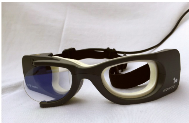
2. ábra | A HINTS-teszt objektív vizsgálatára alkalmas videoregisztrált fejimpulzusteszt-szemüveg

Az SBO-ra érzékeny, akut szédüléssel jelentkező betegek panaszai mögött az esetek többségében jóindulatú okok állnak. Néhány páciens azonban súlyos, akár életet veszélyeztető betegség miatt szédül. A potenciálisan veszélyes állapotot meg kell különböztetnünk a jóindulatú, veszélytelen okoktól. Nehezíti a dolgunkat, hogy a neurológiai gócjelek néha nagyon rejtettek, de veszélyes okokra mutathatnak, ezért keresnünk kell őket (Deadly D's). A páciensek kivizsgálása a részletes anamnéziszfélével alapszik. Fontos, hogy észleljük a kísérő tüneteket. Hirtelen, súlyos, folyamatos fejfájás, aránytalanul súlyos hányás, járásképtelenség háttérben gyakran hátsó scalai stroke állhat. Tudnunk kell, hogy minden vertigo, függetlenül attól, hogy perifériás vagy centrális, fokozódik a fejmozgatásra. A szédülés időtartama és a tünetek visszatérése szignifikáns jelentőséggel bír. A 24 órán túl tartó szédüléssel panaszok (AVS) segítenek kizárni az átmeneti szédüléssel szindrómákat. Az AVS-t leggyakrabban vestibularis neuritis vagy agytörzsi, illetve kisagyi stroke okozza. A diagnosztikai folyamat első lépcsője a részletes anamnéziszfélével, hangsúlyozottan rákérdezve a szédülés időtartamára, a prodromális tünetek, kísérő tünetek,