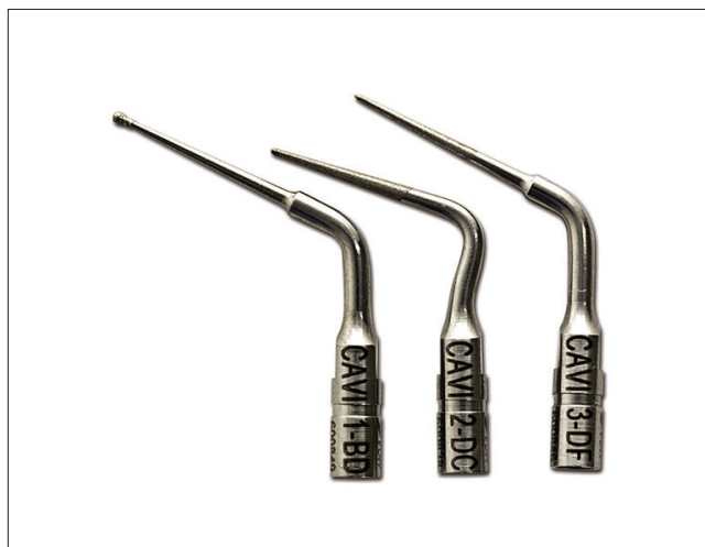
1. kép: Gyémántbevonatú ultrahangos preparáló fejek a pulpakamra falainak minimál invazív alakításához (VDW Diamond-coated CAVI tips) [16].

A nagyítás használatának előnyét a járulékos csa-