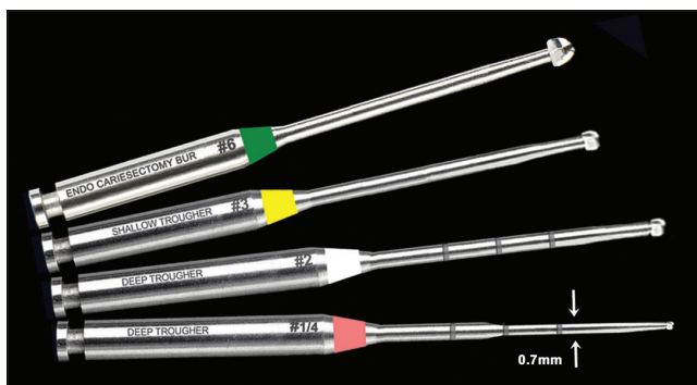
2. kép: Endodonciai fúrók csatornakereséshez és dentin szelektív eltávolításához (CJM Engineering – Muncie Discovery Burs) [15]