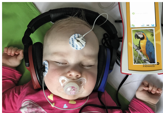
1. ábra Szűrő BERA-vizsgálat. A fejbőrré helyezett elektródák segítségével regisztráljuk a hanginger által kiváltott agytörzsi válaszokat

Magyarországon évtizedek óta kötelező a hallásszűrés 0 és 4 napos kor között, annak idején azonban ez kevésbé megbízható, szubjektív módszerekkel történt. Ezért már az 1990-es évek óta voltak regionális törekvések a szűrés objektív módszerrel történő megvalósítására. Egyes újszülöttsztyályokon a belső fül működését regisztráló otoakusztikus emisszió mérést végeztek [14–16]. Az Emberi Erőforrások Minisztériuma 2015-ben módosító rendeletet adott ki az újszülöttkori hallásszűrésről, mely kötelezővé teszi minden megszületett gyermeknél 0–4 napos korban az objektív hallásvizsgálatot [17, 18]. A kiadott szakmai irányelv szerint minden újszülöttnél szűrő BERA- (brainstem evoked response audiometry – agytörzsi kiváltott válasz audiometria) vizsgálat elvégzése szükséges [19] (1. ábra). Az agytörzsi kiváltott válaszok regisztrálása biztosítja csaknem a teljes hallórendszer működésének vizsgálatát, így szinte mind egyik típusú halláscsökkenés esete kiszűrésre kerülhet [20]. A hangvezető rendszer, a belső fül és a hallópálya betegsége esetén nem kapunk megfelelő eredményt.