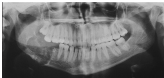
3. kép: Kontroll OPG. A képlet eltávolítását követően a csontdefektust spongiosa forgáccsal töltötték fel.

Az odontomák eltávolítása kétféle módon történhet: intraorális megközelítésből, illetve, ha az elváltozás a mandibulában nagy kiterjedést mutat, akkor az extraorális megközelítés a megfelelő hozzáférés érdekében előnyösebb lehet. A legtöbb enucleatio gyors folyamat és nem igényel speciális előkészítést: a fogorvosi rendelőben, helyi érzéstelenítésben végrehajtható. Azonban kiterjedtebb elváltozásoknál már célszerű általános érzéstelenítés mellett végrehajtani a beavatkozást, majd kórházi ellátásban részesíteni a páciens. Az elváltozások eltávolítása után a kialakult üreget körültekintően át kell vizsgálni, meg kell győződni arról, hogy a tumorszövet teljes egészében eltávolításra került. Ennek