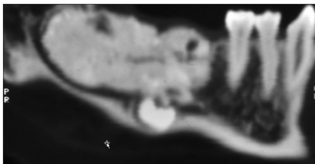
2. kép: A CT felvételen jól látható az odontoma, a diszlokált moláris fog és a canalis mandibulae lefutása

Napjainkban modern radiológiai eljárásokat is alkalmaznak az odontomák pontosabb diagnosztikájához. Ezek azonban legtöbbször csak térítés ellenében vehetők igénybe és az elváltozások pontosabb lokalizációjában (pl. műtét tervezésében) játszanak szerepet. Az odontomák a CT-n, illetve a CBCT-n is radiopaque megjelenést mutatnak, körülöttük radiolucens szegély figyelhető meg (2. kép). A CT hazánkban ingyenes, azonban kevésbé részletgazdag, főként az alsó áll-