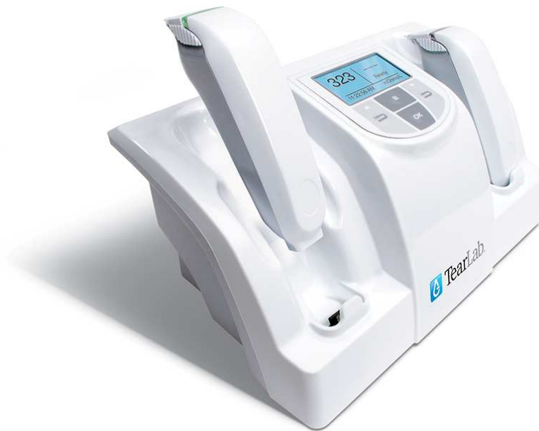
1. ábra. TearLab ozmolaritás mérő készülék (TearLab Inc., San Diego, CA, USA)

Egyes szerzők szerint az objektív klinikai tesztek közül a könny ozmolaritása mutat a legszorosabb korrelációt a szárazszem-betegség súlyosságával [29, 32-34], és a terápia hatására bekövetkező javulással [18]. Más szerzők eredményei szerint azonban a könnyozmolaritás nem mutatott összefüggést a panaszok intenzitásával és a többi objektív vizsgálattal [36, 68], illetve a panaszok és a szemfelszíni festődés terápiás változásaival sem [31]. Módis tanulmánya szerint a TearLab rendszerrel mért ozmolaritás nem volt képes elkülöníteni az egészséges és száraz szemű egyéneket, ezért önmagában nem, csak a hagyományos diagnosztikus tesztekkel együtt értékelhető [35]. Lemp és munkatársai szerint a 308 mOsm/l feletti könnyozmolaritás-érték enyhe szárazszem-betegségre utal, azonban az enyhe/középsúlyos szárazszem-betegségben még működő kompenzáló mechanizmusok miatt a könnyozmolaritást a többi vizsgálómódszerrel együtt kell értékelni, főként akkor, ha a beteg panaszai és a klinikai tünetek nem mutatnak összefüggést. Eredményeik alapján a középsúlyos/súlyos száraz szem elkülönítése szempontjából a 312 mOsm/L érték esetén a módszer szenzitivitása 73%, specificitása 92% [29]. Tomlison és munkatársai eredményei szerint a száraz