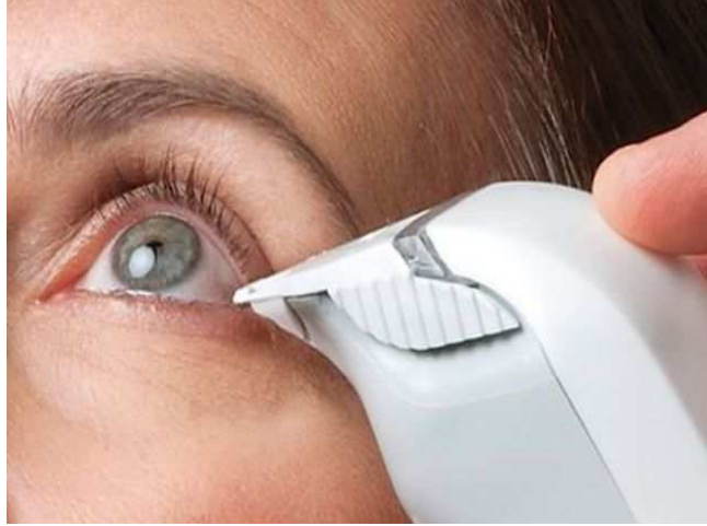
2. ábra. Mintavétel a TearLab ozmométer segítségével

szemes betegek egészségesektől való elkülönítésében a 316mOsm/L érték szenzitivitása 59%, specificitása 94% volt [33].