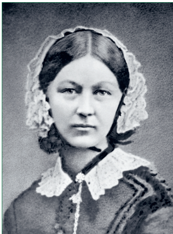
7. kép: Florence Nightingale

képezne országos szinten egyfajta kampány elindítása annak érdekében, hogy többen válasszák az ápolói pályát. Kiemelkedően fontos lenne kivívni az egészségügyi szakdolgozók megbecsülését, és a szakdolgozói életpályát ismét vonzóvá tenni.