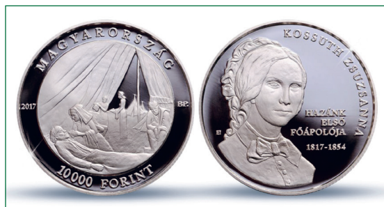
6. kép: Kossuth Zsuzsanna ezüst emlékérem

Ápolói tevékenysége és szerzett tapasztalatai alapján elkezdtek különböző tervek kidolgozni az ápolók szakmai szakképzésével kapcsolatban, de sajnos az 1848-1849-es forradalom és szabadságharc elesése miatt a bevezetése nem valósulhatott meg.